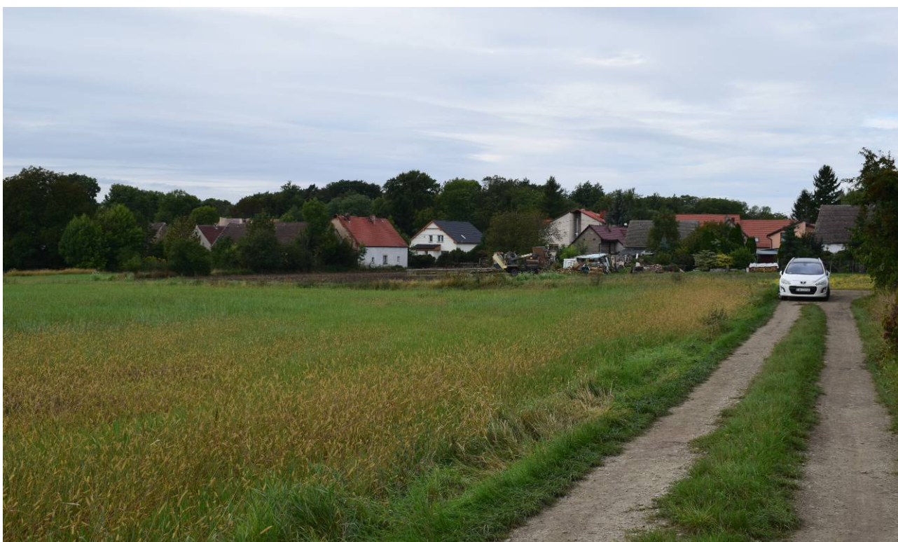
Widok z drogi transportu rolnego na działkę nr 132 na działkę nr ewid. 134 w Pęczu (po lewej stronie). W oddali widoczna istniejąca zabudowa wsi zagrodowa i jednorodzinna.

Rozwój miejscowości następuje zgodnie z wyznaczonymi terenami przeznaczonymi pod zabudowę w obowiązującym miejscowym planie zagospodarowania przestrzennego dla miejscowości Pęcz, Mikoszków.