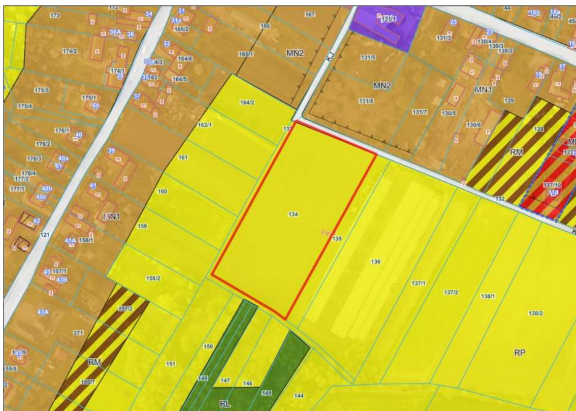
Granice projektu planu miejscowego dla części miejscowości Pęcz - dz. nr 134 (czerwona linia) na tle fragmentu obowiązującego miejscowego planu zagospodarowania przestrzennego dla miejscowości Pęcz, Mikoszków oraz części miejscowości Strzelin, gm. Strzelin (Uchwała Nr XVIII/193/2004 z 26 lutego 2004 r.)