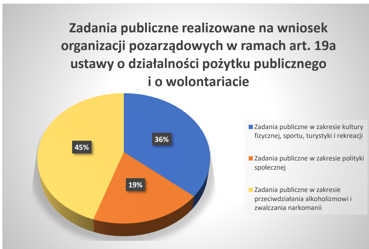
Ryc. 1. Procentowy udział środków finansowych przeznaczonych na realizację zadań publicznych w zakresie art. 19a ustawy o działalności pożytku publicznego i o wolontariacie w 2023 roku.