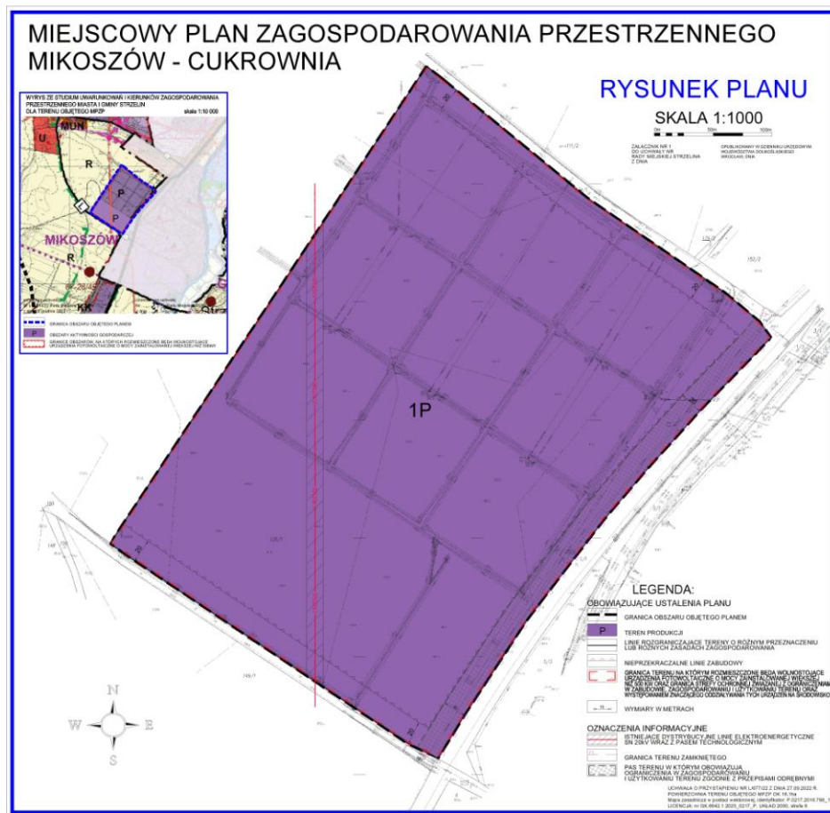
Ryc. 1 Rysunek projektu miejscowego planu zagospodarowania przestrzennego MIKOSZÓW CUKROWNIA

emisji zanieczyszczeń pyłowych i gazowych, zanieczyszczenia wód podziemnych i powierzchniowych, natężenia pola elektromagnetycznego poza granicami terenu, do którego inwestor posiada tytuł prawny, z wyłączeniem inwestycji w zakresie elektroenergetyki lub telekomunikacji.