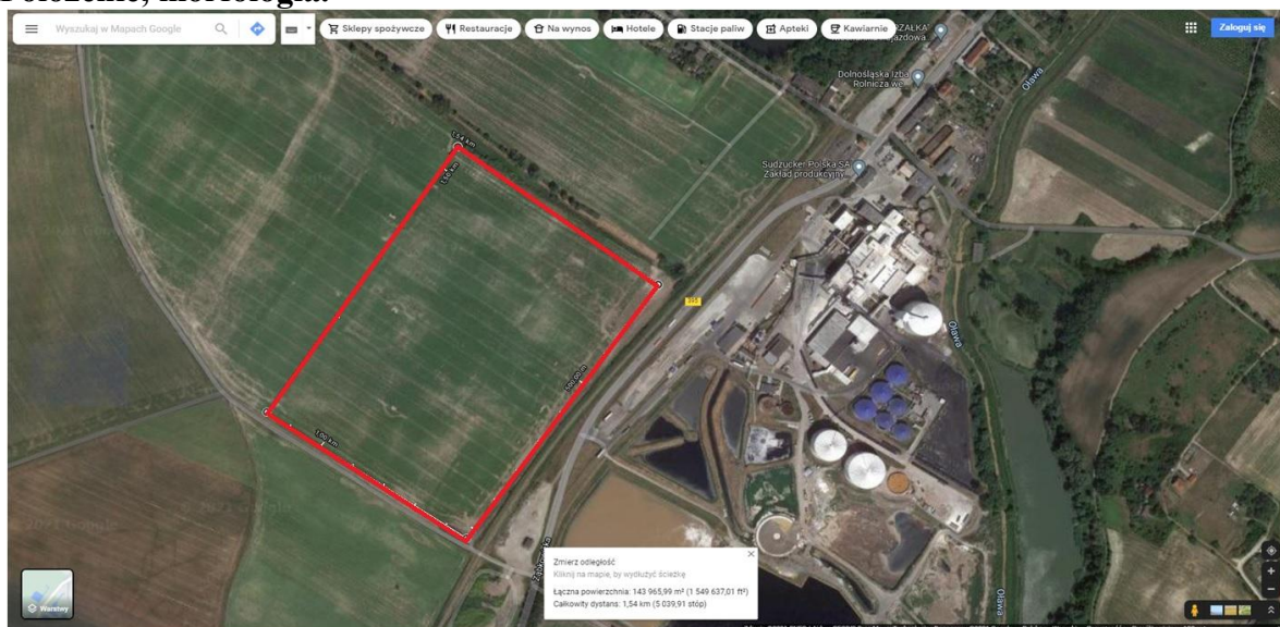
Ryc. 1. Położenie obszaru opracowania w gminie Strzelin.