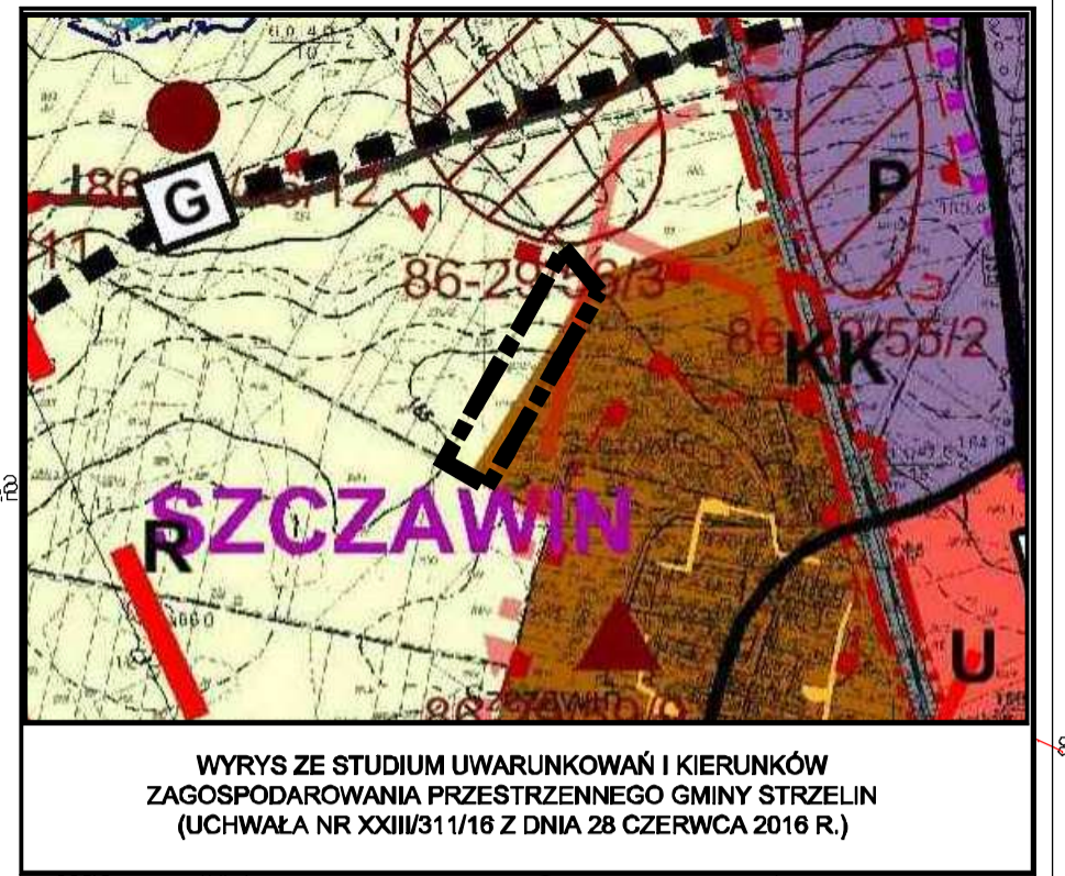
WYRYS ZE STUDIUM UWARUNKOWAŃ I KIERUNKÓW ZAGOSPODAROWANIA PRZESTRZENNEGO GMINY STRZELIN (UCHWAŁA NR XXIII/31/1/16 Z DNIA 28 CZERWCA 2016 R.)