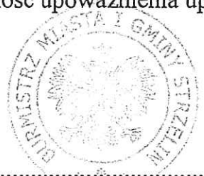
( okrągła pieczęć )

Ważność upoważnienia upływa z dniem 12 sierpnia 2016r