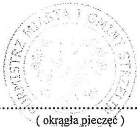
( okrągła pieczęć )

Ważność upoważnienia upływa z dniem 31 marca 2016r