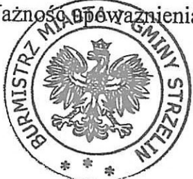
( okrągła pieczęć )

Ważność upoważnienia upływa z dniem 31 marca 2014r.